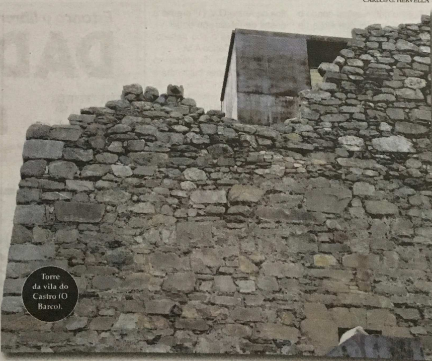
Torre da vila do Castro (O Barco).

Séculos atrás, cando o período medieval chegaba á súa fin, polas terras do oriente ourensán non só era posible ver campesiños afanándose en traballar a terra, clérigos e monxes pronunciando oracións ou cabaleiros exercendo o poder desde torres ou castelos. Naquel tempo tamén habitaron, percorreron e señorearon estas terras diversas mulleres. Cando menos desde o século XII, as sucesivas abadesas que encabezarón o mosteiro bieito de San Salvador de Sobrado de Trives tiveron un destacado poder público, social e económico na zona. Mais esas non foron as únicas mulleres poderosas nas terras próximas ao Sil e o Bibei durante a Idade Media.