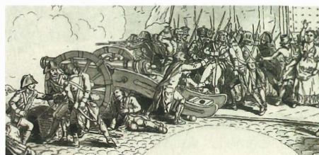
MUERTE DE DAOIZ Y VELARDE en la defensa de Madrid contra las tropas francesas el 2 de mayo de 1808.