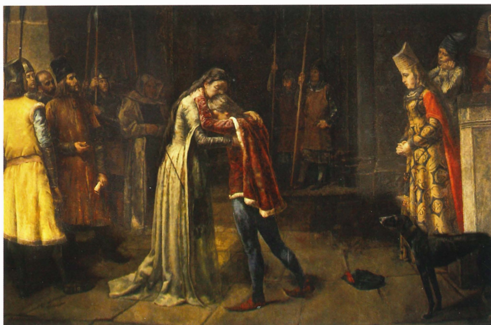
Recreación de FADRIQUE ALFONSO despidiéndose de su madre LEONOR en presencia de la reina MARÍA DE PORTUGAL.